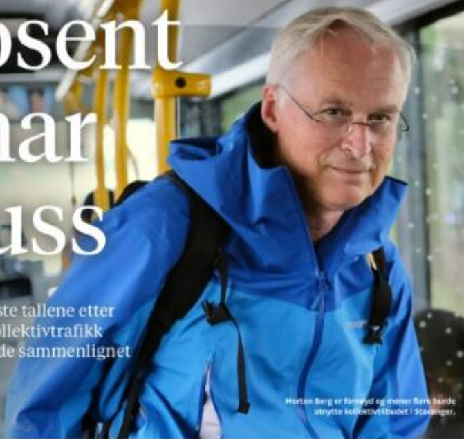
Morten Berg er fotograf og innrer. Bilde uttrykte kollektivtrafikket i Stavanger.